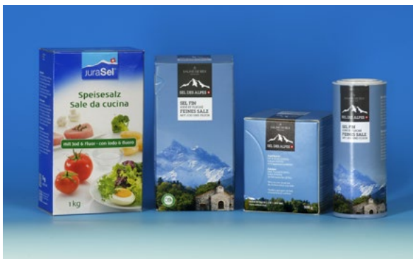
Fluoridiertes und jodiertes Speisesalz.

Geringe Mengen von Fluorid sind im Trinkwasser und in Lebensmitteln vorhanden. Die Fluoridkonzentrationen sind aber im allgemeinen sehr niedrig, so dass keine kariesvorbeugende Wirkung auftreten kann. Für einen wirksamen Kariesschutz steht in der Schweiz seit 1983 das jodierte und fluoridierte Speisesalz zur Verfügung (z. B. JuraSel im Paket mit grünem Streifen, das 0,025 % Fluorid enthält). Zur Grundvorbeugung gehört auch die tägliche Benützung von fluoridhaltiger Zahnpaste.