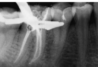
En haut Cliché radiographique pour la détermination de la longueur des canaux apicaux.