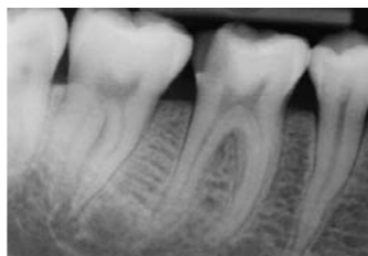
Dent malade présentant une carie profonde. Signes d'inflammation visibles au niveau de la pointe de la racine.

La capacité de la pulpe à se défendre par ses propres moyens est réduite du fait de sa situation particulière à l'intérieur de la dent. En cas d'inflammation, la pulpe n'est plus en mesure de guérir spontanément. On constate alors la destruction de la pulpe dentaire (« dent morte »). Lorsque des bactéries se propagent à l'intérieur de la dent en direction de l'os de la mâchoire, les défenses propres de l'organisme réagissent soit sous la forme d'un encapsulement (granulome ou kyste), soit par la formation de pus au niveau de la pointe de la racine (abcès).