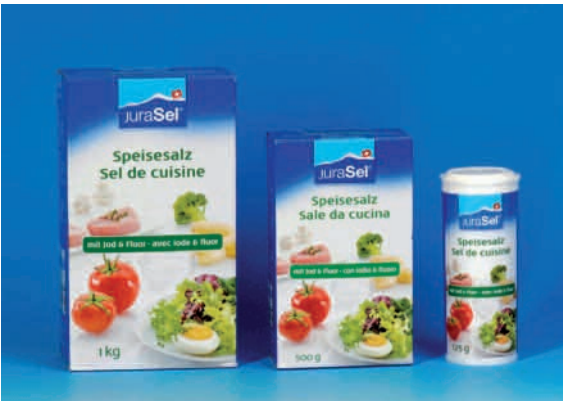
Fluoridiertes und jodiertes Speisesalz.

Geringe Mengen von Fluorid sind im Trinkwasser und in Lebensmitteln vorhanden. Die Fluoridkonzentrationen sind aber im allgemeinen sehr niedrig, so dass keine kariesvorbeugende Wirkung auftreten kann. Für einen wirksamen Kariesschutz steht in der Schweiz seit 1983 das jodierte und fluoridierte Speisesalz zur Verfügung (JuraSel im Paket mit grünem Streifen, das 0,025% Fluorid enthält). Zur Grundvorbeugung gehört auch die tägliche Benützung von fluoridhaltiger Zahnpaste.