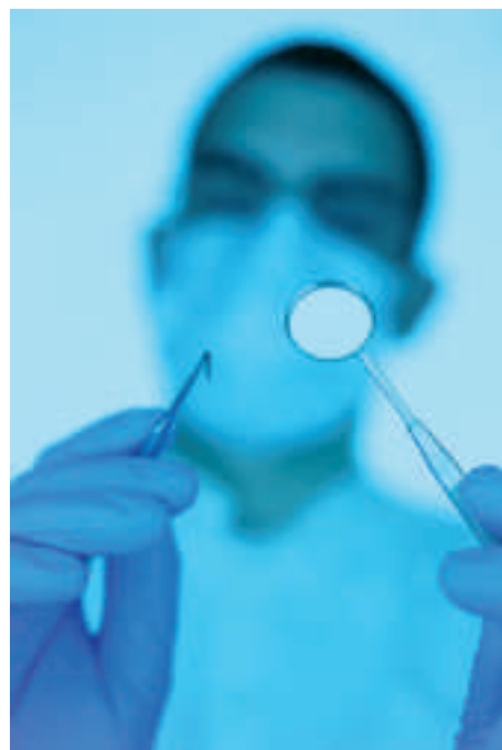
Votre médecin-dentiste est-il un médecin-dentiste SSO?

Si le médecin-dentiste n'est pas membre de la SSO, la seule voie pour le patient est celle de la justice ordinaire.