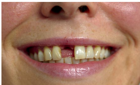
Pour de nombreux patients, les implants permettent la pose de dents artificielles en cas de lacunes dentaires.

Pour l'augmentation osseuse, on utilise également fréquemment une membrane en plus du matériau osseux de substitution. Cette membrane doit éviter que les cellules à croissance rapide des tissus mous (la gencive) ne combinent la lacune. Ainsi, les médecins-dentistes peuvent « guider » la régénération osseuse.