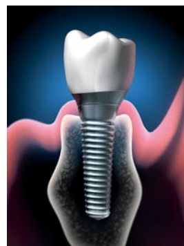
Les implants sont des vis, le plus souvent en titane, sur lesquelles la prothèse (dent artificielle) peut être fixée.