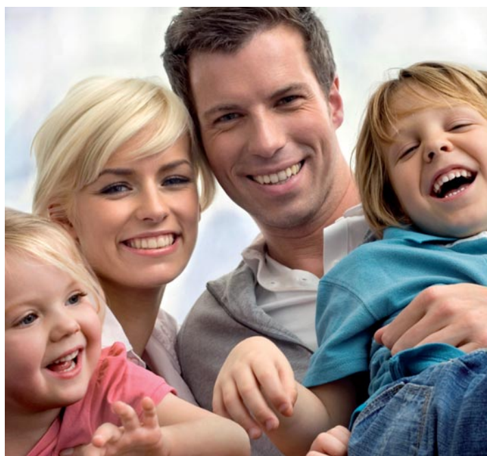
Da 125 anni la SSO si impegna a favore della salute orale della popolazione svizzera.

Per celebrare degnamente l'anniversario, molti dentisti membri della SSO vi ringrazieranno per la vostra fedeltà offrendovi dei piccoli omaggi. A partire da metà luglio, per esempio, potrete ricevere un bellissimo nécessaire, che vi tornerà molto