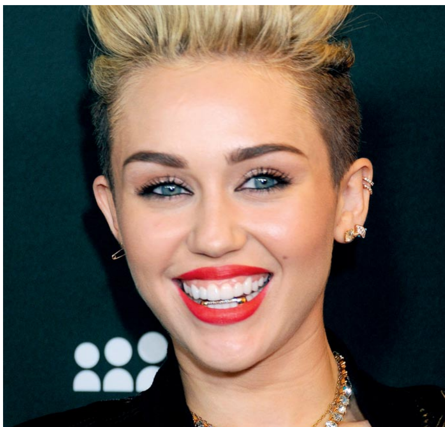
Miley Cyrus con un grillz

In Svizzera, i grillz non li porta praticamente nessuno ed è un bene per i denti, perché chi si mette un grillz deve prestare particolare attenzione alla propria igiene orale. Sotto i gioielli, infatti, si possono annidare batteri in grado di provocare carie o gengiviti. A lungo termine, i grillz a basso costo che non si adeguano perfettamente ai denti possono consumare e danneggiare i denti per sempre.