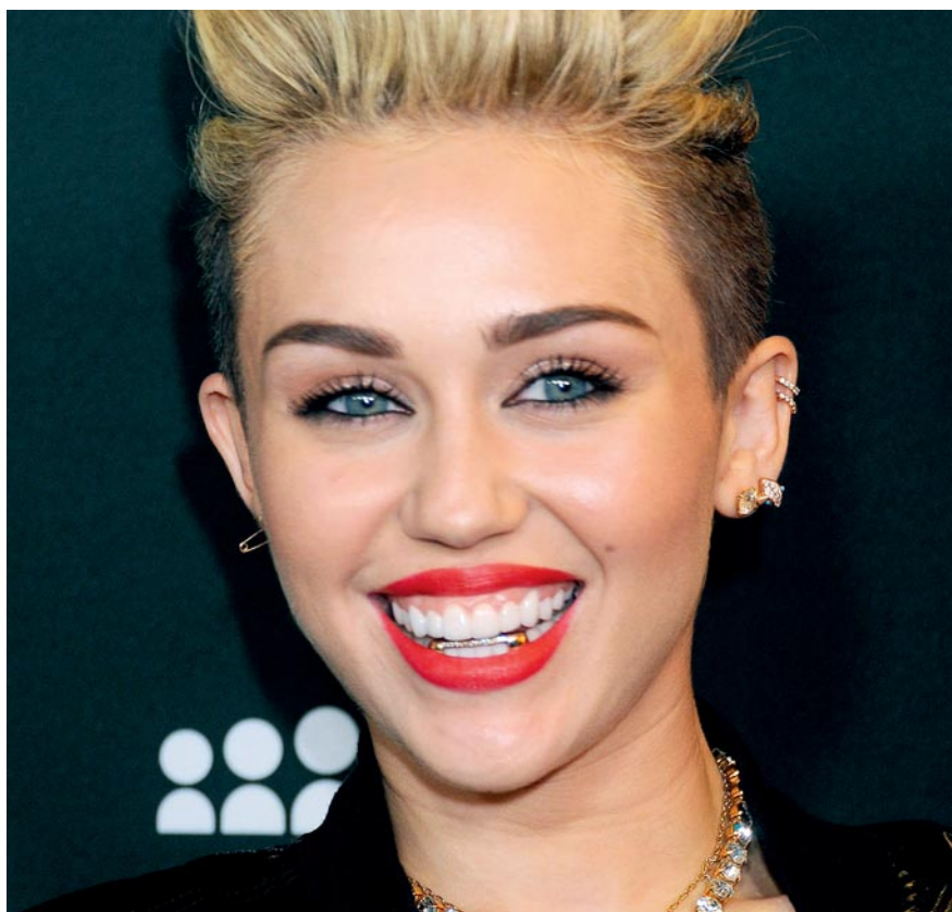
Miley Cyrus et son grillz

En Suisse, les bouches parées de grillz ne courent pas les rues. Et c'est tant mieux pour les dents. Sous les grillz peuvent en effet se former des colonies de bactéries provoquant caries et gingivites. Attention, donc, à son hygiène dentaire. Parce que, mal adaptés aux dents du porteur, les grillz bon marché peuvent en outre, par frottement et abrasion, causer aux dents des dommages irréversibles.