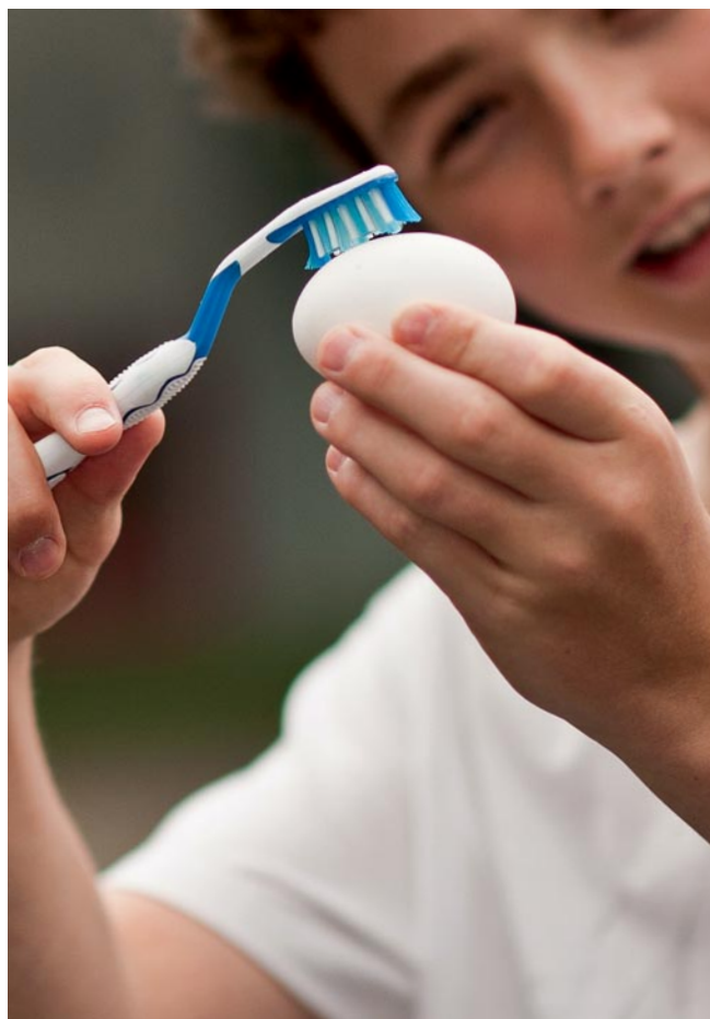
Cosa succede allo smalto dei denti quando si beve una bevanda energetica? Lo spiega l'esperimento con l'uovo.

Grazie a una serie di esperimenti scientifici, gli allievi di scuola media migliorano le loro conoscenze sulla salute orale. Cosa succede se immergo un uovo sodo nel succo d'arancia e, in seguito, lo pulisco con uno spazzolino da denti? Cambia qualcosa se uso un dentifricio sbiancante? E se invece immergo l'uovo nell'acqua minerale? Durante gli esperimenti, gli allievi scoprono gli effetti di determinati alimenti e delle sigarette sui denti. L'obiettivo è sensibilizzare maggiormente i giovani affinché curino meglio la propria igiene orale e consumino cibi e bevande che non danneggiano i denti.