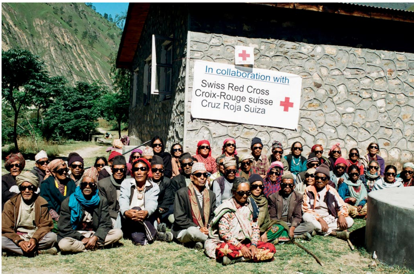
Dopo l'operazione, grazie all'oro vecchio dei denti e ai gioielli svizzeri, questi pazienti nepalesi rientrano al loro domicilio autonomamente.