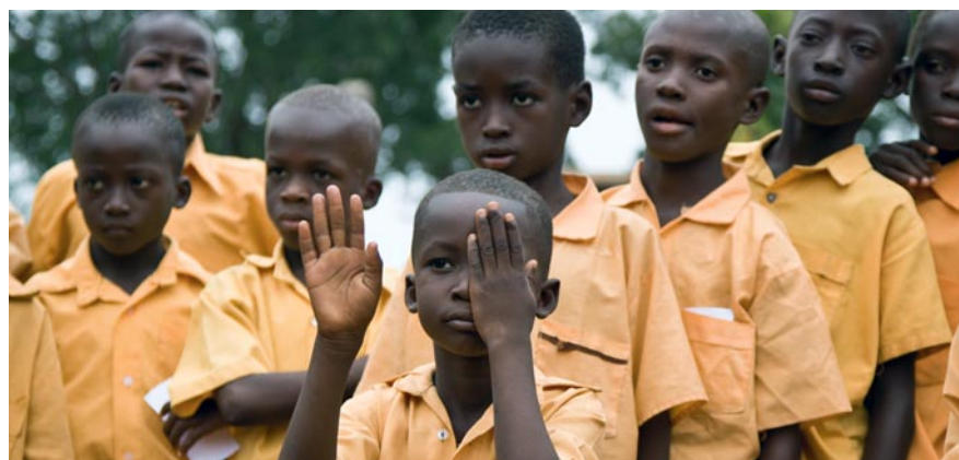
Les tests pratiqués à l'école contribuent à un diagnostic précoce des affections oculaires.

Cinquante francs suffisent pour opérer quelqu'un de la cataracte et faire d'un œil aveugle un œil qui voit. 50 francs! Que cela suffise pour donner à quelqu'un un nouveau départ dans la vie, voilà pour moi et l'équipe du projet «Redonner la vue» le bonheur absolu et la plus belle des motivations.