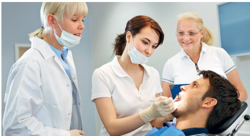
La formation des assistantes en prophylaxie et des hygiénistes dentaires comprend nécessairement un stage consacré aux gestes techniques.

Vous trouverez d'autres informations sur les métiers du cabinet dentaire sous www.sso.ch