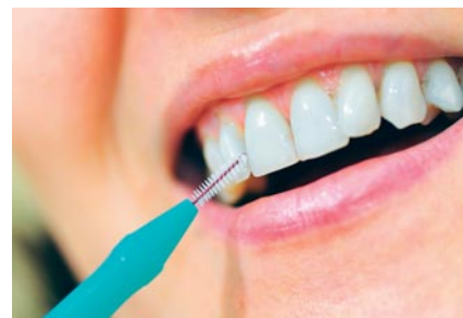
Les brosselettes interdentaires, pour des espaces entre les dents parfaitement propres.

nettoyer entre les dents, elles existent en plusieurs grandeurs et pour tous les types de dentition. Chez les patients souffrant de rétraction gingivale et ayant de ce fait de grands espaces interdentaires, elles sont même plus efficaces que le fil dentaire.