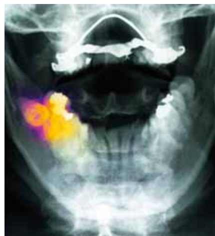
Cette dent de sagesse doit être extraite.

En règle générale, les dents de sagesse font leur éruption autour de la vingtième année. Les dents de sagesse qui ont percé sans difficulté vont compléter notre denture adulte, elles méritent la même attention que toutes les autres dents. Il n'est cependant pas rare qu'elles soient cause de problèmes: la dent de sagesse peut par exemple ne pas avoir assez de place au niveau de la crête de la mâchoire, elle peut présenter une inclinaison défavorable ou rester incluse dans l'os mandibulaire. Dans de tels cas, le médecin-dentiste devra extraire la dent à problèmes.