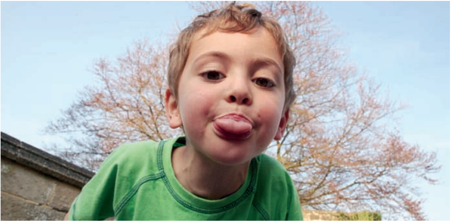
Certaines grimaces font rire - à condition que la langue soit propre.

des bactéries dans la plaque. Étant donné que nous consommons tous les jours des fluorures avec notre alimentation, il n'existe pas de risque de manque de fluorures dans le cas d'une alimentation saine. Un surdosage peut par contre, et cela avant tout chez les enfants, être à l'origine de fluorose. Il est de peu d'importance de savoir si la bouche doit être rincée ou si l'on peut se contenter de simplement cracher après le brossage des dents: même après un bref rinçage, il reste une concentration suffisante en fluorures dans la bouche pour assurer une action protectrice sur les dents.