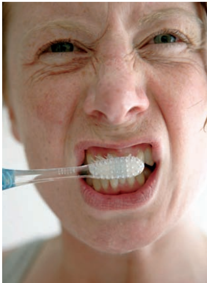
Frotter sans conviction, un risque pour les dents.

emploi trop fréquent peut provoquer des lésions de la substance solide des dents. On recommande par conséquent de n'utiliser pas plus souvent que deux fois par semaine de telles pâtes dentifrices blanchissantes. Pour un usage quotidien, il faut utiliser une pâte dentifrice qui a un indice d'abrasion moyen (indice RDA), ne dépassant pas 45 au maximum. L'indice RDA (de l'anglais «radioactive dentin abrasion») est une mesure du pouvoir abrasif des particules nettoyantes sur la dentine lors d'un brossage standardisé par comparaison avec une quantité déterminée d'une substance de référence. La détermination de l'indice RDA se fait au moyen de la mesure de l'activité de dentine radioactive marquée préalablement qui est abrasée lors d'un nettoyage standardisé. Les fluorures contenus dans la plupart des pâtes dentifrices servent à la formation de la substance osseuse et de l'émail dentaire, rendant ce dernier plus résistant aux caries et entravant l'activité