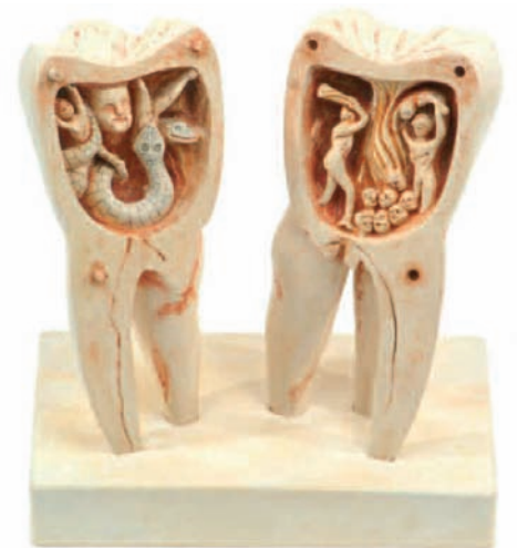
Sculpture sur ivoire intitulée «Le ver dentaire, esprit tourmenteur de l'Enfer», Sud de la France, 17 ème siècle, haute d'environ 10, 5 cm, peut se séparer en deux parties.

Hippocrate avait pourtant déjà constaté que le mal de dent pouvait être combattu par les soins donnés aux dents. Le grand médecin grec de l'Antiquité écrivait vers 400 av. J.-C.: «La carie n'est pas due à un ver, d'autres éléments sont en cause.» Il recommandait de nettoyer chaque jour dents et gencives. Dans la Mésopotamie ancienne, les dents étaient nettoyées avec un mélange d'écorce d'arbre, de menthe et d'alun. En Inde ancienne, on se servait d'une substance faite d'extraits de berbérus et de poivre. Au cours de la douzième dynastie égyptienne, les princesses employaient le vert-de-gris, les vapeurs d'encens et une pâte faite de bière artisanale et de safran. Les cure-dents en bois, tuyaux de plume ou autres matériaux étaient connus de toutes les civilisations.