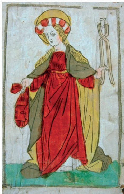
Sainte Apollonie, qui a vécu au 3 ème siècle apr. J.-C. à Alexandrie (Égypte). Elle est la sainte patronne des dentistes et réputée secourable contre le mal de dents.

ment rendu compte de la relation existant entre le nettoyage régulier des dents et des dents en bonne santé. Le siwak, un bâtonnet en forme de pinceau provenant des racines riches en fibres ou du bois de l'arak (appelé aussi arbre à brosse à dents), est encore fort répandu de nos jours. Mais les découvertes des arabes n'ont que peu intéressé l'Europe. Ici, l'hygiène dentaire a suivi des chemins tout différents. Ainsi, la Sainte Eglise romaine promettait: «Celui qui vénère le nom de la sainte martyr et vierge Apollonie sera, ce jour-là, délivré du mal de dent.» Ainsi, aux 13 ème et 14 ème siècles, Sainte Apollonie a pu entreprendre sa marche triomphale de sainte protectrice de ceux qui souffrent des dents. Quand les prières ne suffisaient plus, la croyance populaire