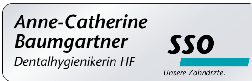
Badge «équipe du cabinet dentaire» en aluminium, aimanté (69 x 21 mm)

Ich wünsche SSO-Namensschilder (Preis CHF 12.– / Ex., zuzüglich MWSt. und Porto) mit folgenden Angaben (Funktionsbezeichnungen Dr., Dr. med. dent., med. dent. oder fürs Praxisteam: Name + Dentalassistentin, Dentalassistentin i.A., Prophylaxeassistentin, Dentalhygienikerin HF):