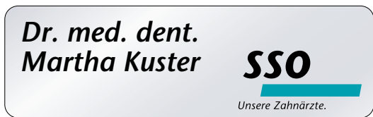
Namensschild aus Alu, magnetisch (69 x 21 mm)